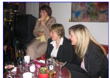
Ausgelassene und entspannte Stimmung zu fortgeschrittener Stunde im Hotelfoyer.

gebnis bei Live-Musik bis tief in die Nacht gefeiert.