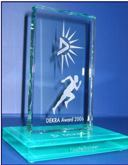
Unser Stolz, unser DEKRA-Award Pokal.

Der DEKRA Award ist einer der führenden Qualitäts-Managementpreise und wird seit 1999 vergeben. Die Bewertung der Unternehmen erfolgt anhand von fünf gewichteten Kriterien (siehe nebenstehende Tabelle). Auf einer Notenskala von 1 – 5 erzielte TKW die aufgeführten Noten. Die Gewinner sind: