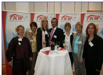
TKW-Team in Anspannung: Auf dem Stand des Unternehmerforums in der Pause vor der Preisverkleidung.

Doch wie gut wir im Vergleich zu anderen Unternehmen tatsächlich sind, das sollten wir erst am 22. März 2006 erfahren. Die Anspannung war daher riesig, als wir – 10 Mitarbeiter und unser Chef