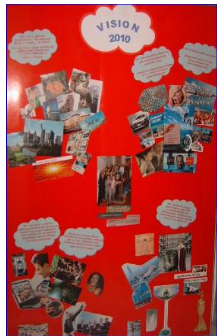
Unsere Visions-Wand in der Firmenzentrale