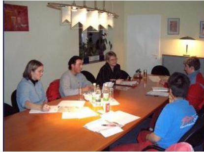
Azubi-Meeting zum Thema Unternehmenswerte.

Der Tag bestand aus zwei Teilen: Zunächst wurde uns Auszubildenden alles über das TKW Credo, Leitsatz, Werte und die Vision erklärt. Gemeinsam haben wir das Wort „TEAM“ definiert und alle Auszubildenden waren sich einig, dass sie zum Erfolg des „TEAM“ von TKW beitragen wollen. Zum zweiten Teil des Tages konnten wir dies unter Beweis stellen. Für die bestandene EMAS-Zertifizierung hat-