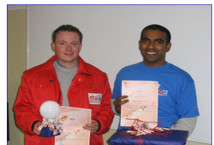
Zwei strahlende Sieger nach der Auszeichnung.